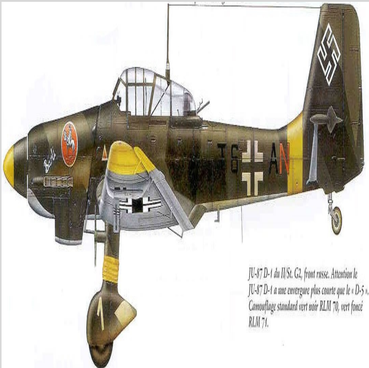
JU-87 D-1 du II/St. G2, front russe. Attention le JU-87 D-1 a une envergure plus courte que le « D-5 ». Camouflage standard vert noir RLM 70, vert foncé RLM 71.